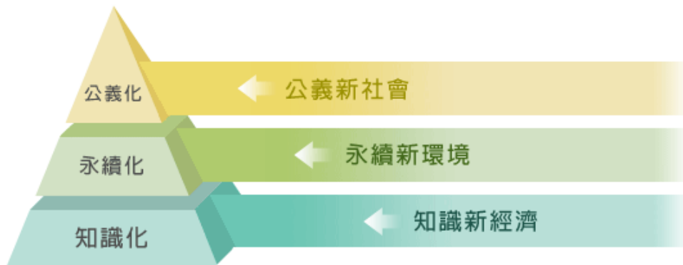
圖二：綠色矽島建設藍圖

從李登輝主政到2008年5月民進黨下台，其間台灣沒有擺脫「中華民國」，國家沒有正常化，國家機器事實上大概只有20%回歸正常化和專業化，但是，因為主政者具有台灣主體意識，基本上，還能夠努力提出以台灣為主軸的永續發展三維概念。2001年5月，也就是陳水扁上任後一年，通過「綠色矽島建設藍圖」及相關政策方案（見圖二），永續發展的願景是發展藍圖中重要的構架。