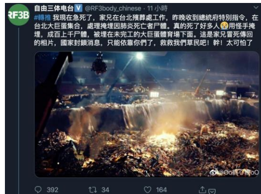
圖2、虛構的爆料文章案例